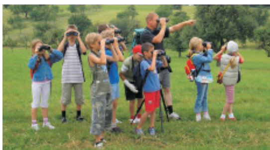
Vögel in allen Richtungen - oder vielleicht doch etwas anderes?

stand wurde spielerisch die Vogelwelt an einem Baggersee erforscht. Das besondere am Kohlplattenschlag ist, dass er ein ehemaliger Baggersee war, der inzwischen komplett eingezäunt ist und keine Besucher zulässt. Nach Bauschlott wurde die ORNI Schule am 22. Juni in die Grundschule eingeladen. Diese Ver-