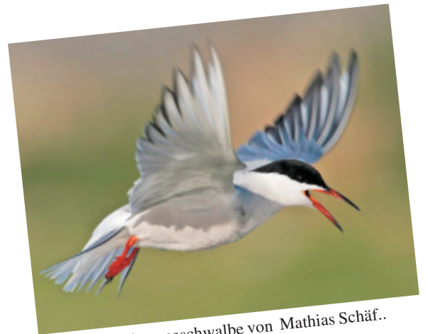
Eine Flussseeschwalbe von Mathias Schäf..

Es freut uns sehr und ein wenig stolz sind wir auch, auf das großzügige Entgegen kommen, unseres Vogelbilderlieferanten. Nach wie vor unterstützt uns Mathias Schäf, Mannheim mit seinen erstklassigen Vogelaufnahmen. Inzwischen findet man seine brillanten Aufnahmen in einschlägigen Zeitschriften.