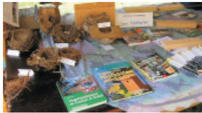
Eine kleine Nesterausstellung und Thomas bei der Standbetreuung.

schließenden Exkursion über die Feldflur konnten Finkenschwärme, Saatkrähen, Dohlen und 12 Rotmilane bei ihrem aktiven Zug beobachtet werden. Zu einer ganz besonderen Veranstal-