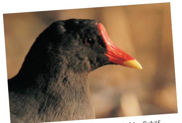
Portrait vom Teichhuhn