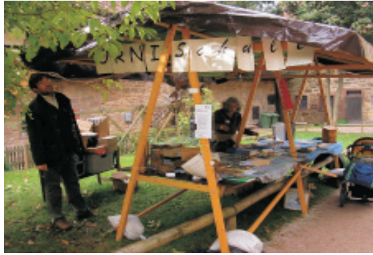
Der Stand ist aufgebaut, alles sitzt.

als Standbetreuer eine wichtige Erfahrung und Bereicherung. Zur besten Vogelzugzeit, am 27. Oktober war die ORNI Schule zur Grundschule nach Adelshofen eingeladen. Bei der an-