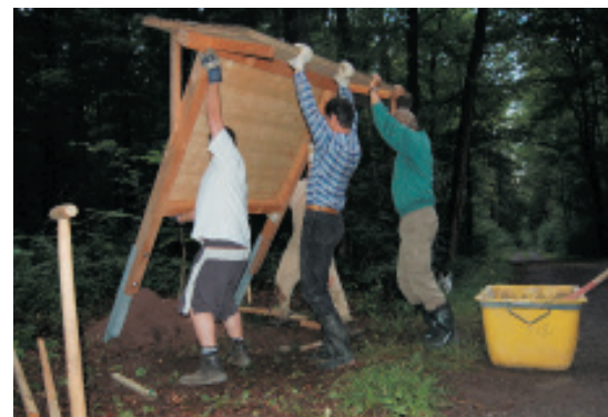
Die fleißigen Helfer beim aufstellen der Informationstafel.

zig kleine Vogelfreunde, trotz Regen mit der Vogelkunde bedient. Die Ausbeute an Vögeln war gering: Haussperlinge am Rathaus, einige vorbei fliegende Tauben und ein Grünfink. Die Nestersuche in den Kugelhornbäumchen dagegen war äußerst erfolgreich. Die anschließende Auswertung der Nester im Bürgersaal mit Frühstück ließ die Kinder das Regenwetter