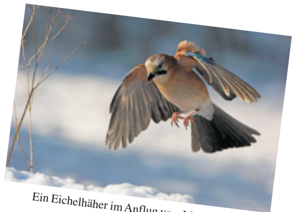
Ein Eichelhäher im Anflug von Mathias Schäf..